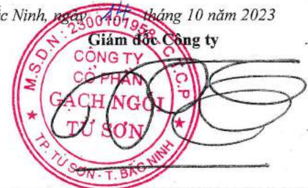
Trần Xuân Hùng