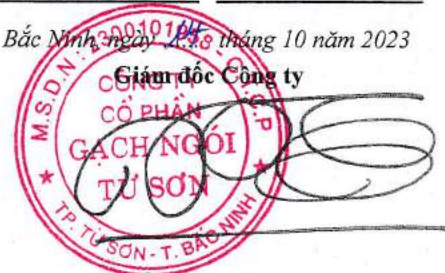
Trần Xuân Hùng