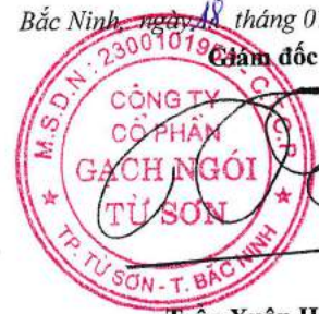
Trần Xuân Hùng